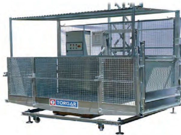
Modèle illustré : PL-15